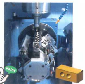
簡単なワークも5軸で儲ける