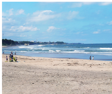
日立市 河原子海水浴場

最後になりましたが、日々成長し販売店様・仕入先様のお役に立てるよう精進して参りますので今後ともご指導・ご鞭撻の程、宜しくお願い申し上げます。