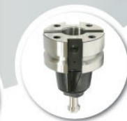
マルチ治具ホルダ