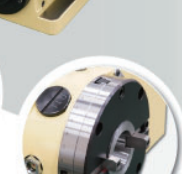
ガイドキー付き テーパフランジ